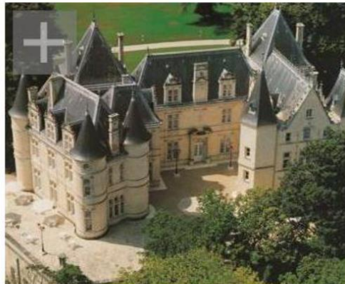
Chateau de Mirambeau