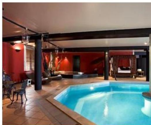
Chateau de Mirambeau