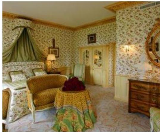
Chateau de Mirambeau