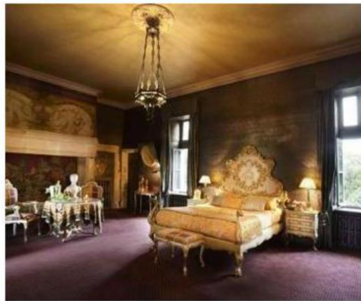
Chateau de Codignat, Suite Aldin