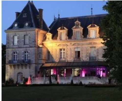
Chateau de Mirambeau