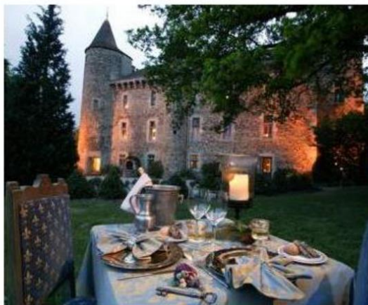
Chateau de Codignat