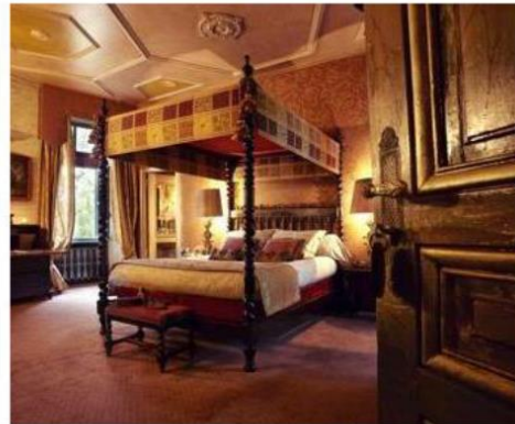
Chateau de Codignat, Chambre Louis XI