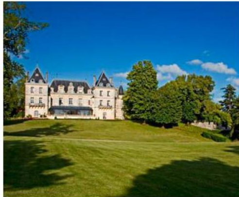
Chateau de Mirambeau